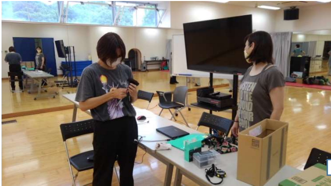
1 配信準備が進みます。