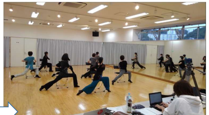
7 終了後、本日の配信についてのスタッフ会議。その後、定例会作品動画の撮影。無事完了です。