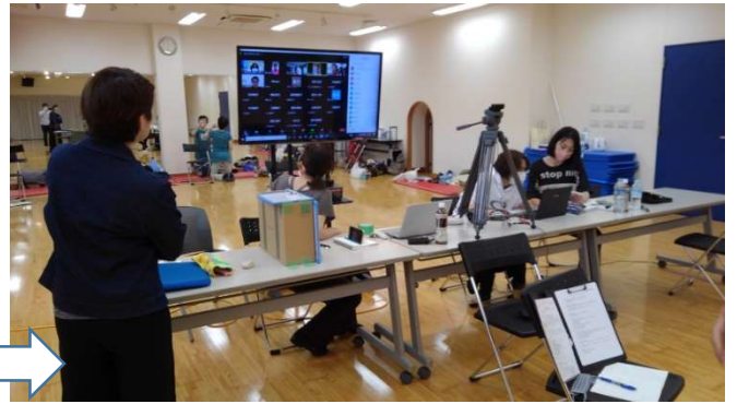
2 Zoom でつながり始めます。順調です。