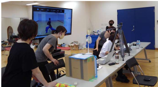
5 ダンスリーダーが配信を支えます。

1回目はストレッチ、2回目は、500mlのペットボトルを持ってトレーニング要素を加え、3回目はダンスムーブメントへの発展形。スローな曲に合わせ、椅子に座って行う作品でしたが、どの回もなかなかハードな6分間でした。