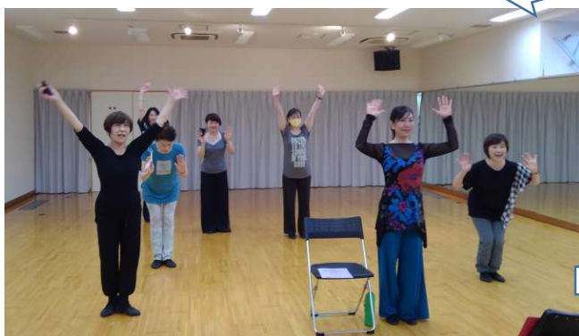
6 お別れの挨拶です。皆様お疲れ様でした。