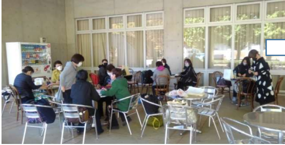
1 10時30分、打ち合わせを始めます。