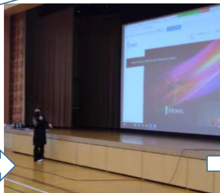
7 飯田先生より、新しくなったHPの紹介がありました。