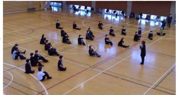
4 飯田先生のご挨拶で定例会スタートです。