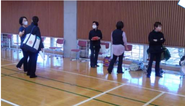
3 久しぶりに顔を合わせ、話がはずみます。