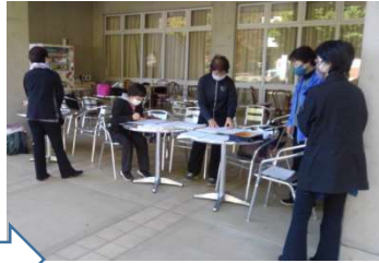
2 12時、受付を設置し、会場の準備に入ります。密にならないよう間隔をあけて椅子も設置しました。