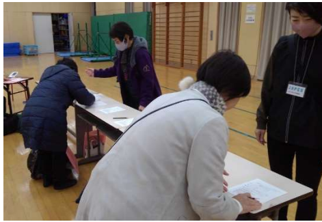
2 健康チェックカード記入