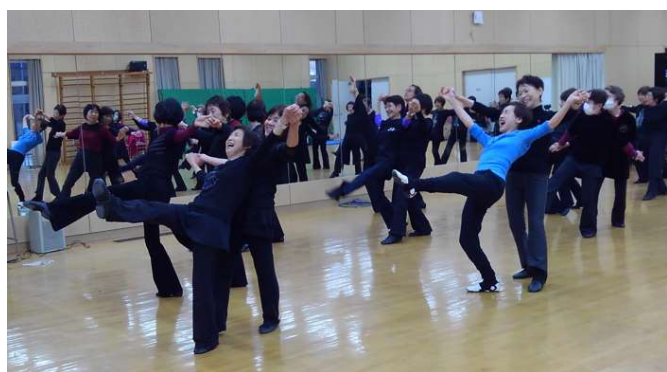
7 最後、大きな円になって踊ります。最後のポーズをきめ、作品が仕上がりました。