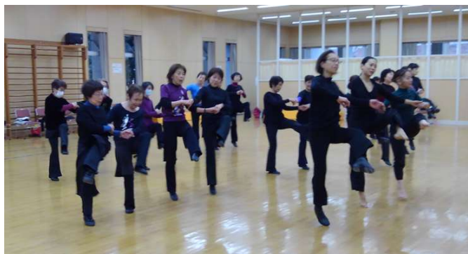
6 2つのグループに分かれて動いてみます。見ているはずなのに、ついつい動いてしまっています。