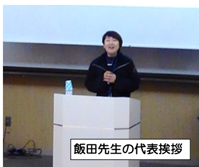
飯田先生の代表挨拶