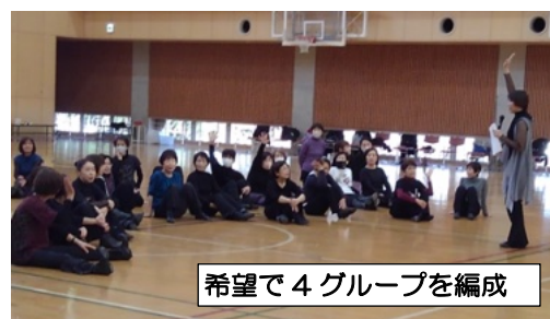
希望で4グループを編成