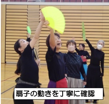
扇子の動きを丁寧に確認