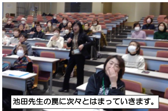
池田先生の真に次々とはまっています。