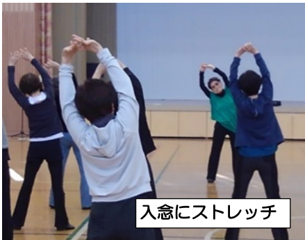
入念にストレッチ