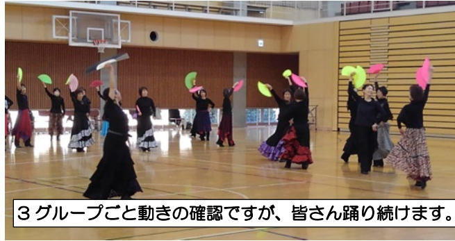
3グループごと動きの確認ですが、皆さん踊り続けます。