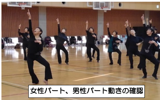
女性パート、男性パート動きの確認