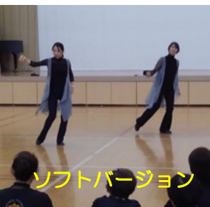
ソフトバージョン