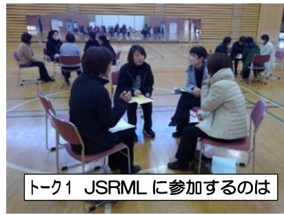
トーク1 JSRMLに参加するのは