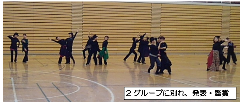
2グループに別れ、発表・鑑賞

【感想】ジャズ苦手だなあと思いながら、ついリズムにのって楽しく動いていました。男性女性の動きのかけ合いが良かったです。