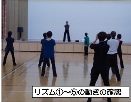
リズム①～⑤の動きの確認