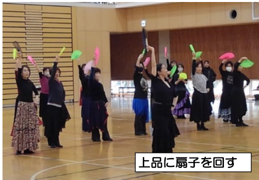
上品に扇子を回す