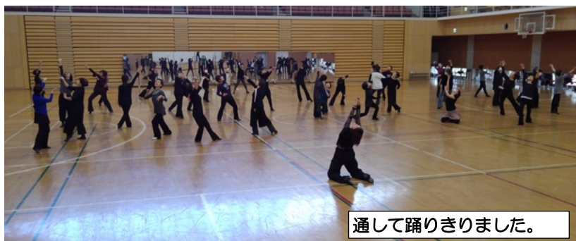
通して踊りきりました。

【感想】曲の勢いで、動きながら身体から力がわき出てきて笑顔になりながら気持ちよく動けました。震災の方達に届くといいなあと、気持ちをこめました。