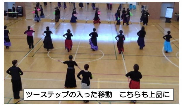
ツーステップの入った移動 こちらも上品に