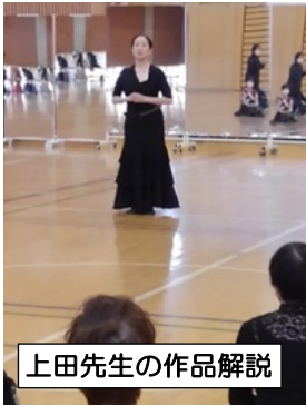
上田先生の作品解説