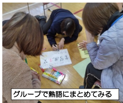
グループで熟語にまとめてみる