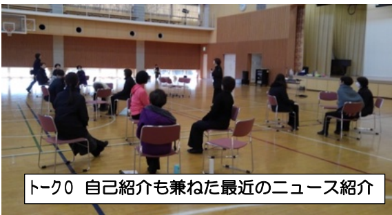
トーク0 自己紹介も兼ねた最近のニュース紹介

自由参加でしたが、31人の方が参加してくださいました。新たなつながりが生まれた貴重な時間となりました。