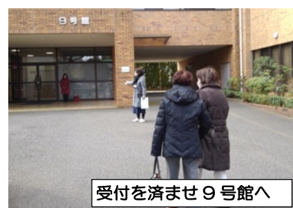
受付を済ませ 9 号館へ