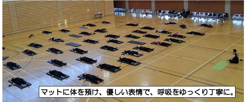
マットに体を預け、優しい表情で、呼吸をゆっくり丁寧に。

【感想】途中でしんどい、しんどーいと思っていましたが、心地よい時もあり、最後はやり切った感じで感謝しています。