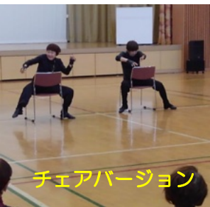
チェアバージョン