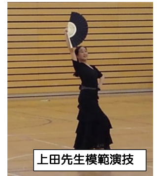
上田先生模範演技

【感想】先生のその気にさせる巧みな話術やパフォーマンスと華麗な動きのギャップ、素晴らしいです。少ししり込みをしていましたが華麗に優雅にできたと思っています。