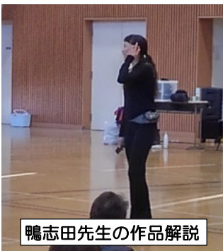
鴨志田先生の作品解説