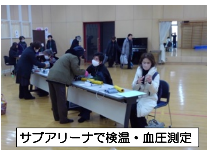
サブアリーナで検温・血圧測定