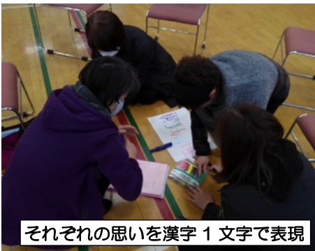
それぞれの思いを漢字1文字で表現