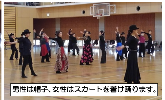
男性は帽子、女性はスカートを着て踊ります。