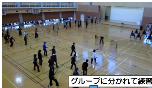
グループに分かれて練習