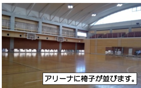
アリーナに椅子が並びます。