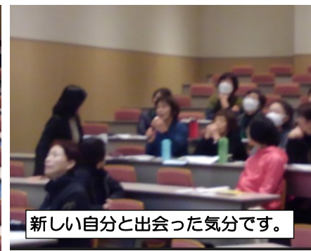
新しい自分と出会った気分です。

【感想】お話がとても上手で、クリティカルシンキングに特に学びを深め、普段の生活においてとても大事な事だと感じました。難しいようなイメージの心理学を楽しく学ぶことができました。