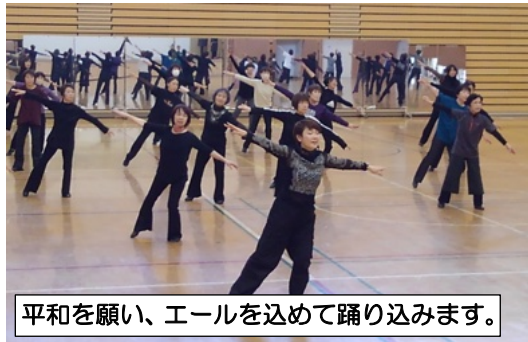
平和を願い、エールを込めて踊り込みます。