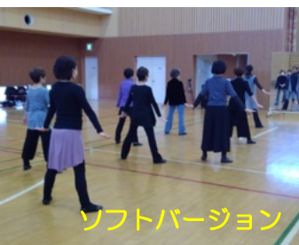
ソフトバージョン