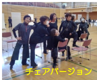
チェアバージョン