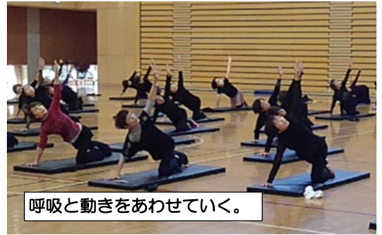
呼吸と動きをあわせていく。