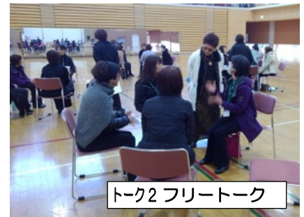
トーク2 フリートーク