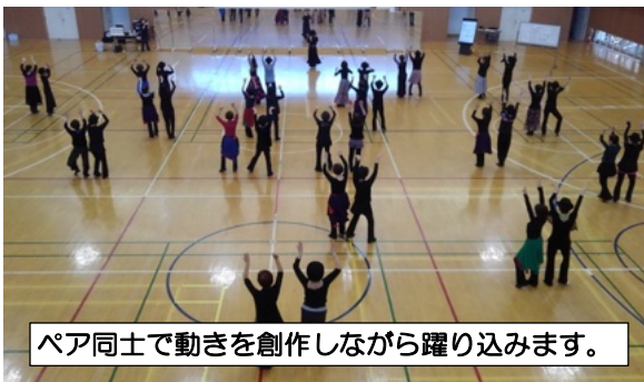
ペア同士で動きを創作しながら躍り込みます。