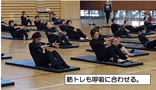
筋トレも呼吸に合わせる。