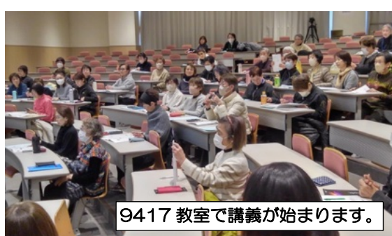
9417 教室で講義が始まります。